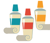
De la peinture