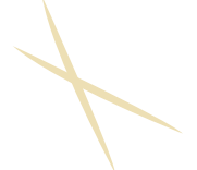
2 piques en bois