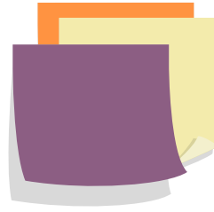
Du papier de couleur