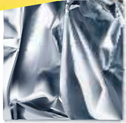
Du papier aluminium